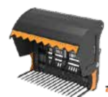
F = med smidde tinder