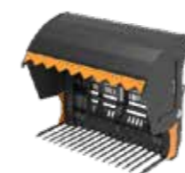
F = med smidde tinder