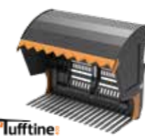
P = med profilerte tinder