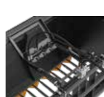
Plast og nettholder