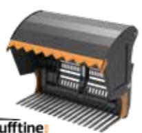
P = med profilerte tinder