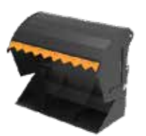
B = med skuff