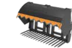
F = med smidde tinder