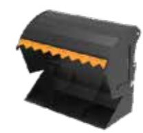
B = med skuff