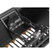
Plast og nettholder