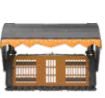
Dekkeplate for rygg