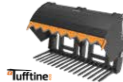
P = med profilerte tinder