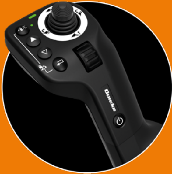
Q E -command